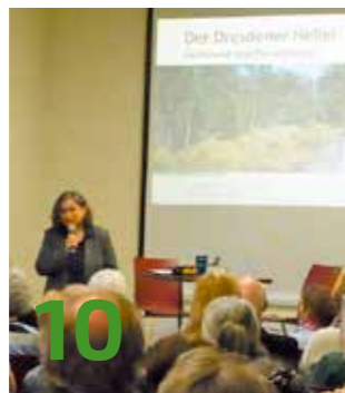
WAS WIRD AUS DEM HELLER?